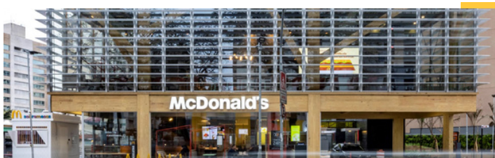
Restaurante insignia - São Paulo Brasil

Click aquí para acceder a nuestro Reporte de Compromiso Social y Desarrollo Sustentable.