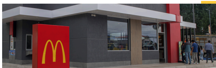
Restaurante insignia - La Prensa, Quito.

Click aquí para acceder a nuestro Reporte de Compromiso Social y Desarrollo Sustentable.