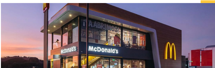
Restaurante insignia - Albrook, Ciudad de Panamá

Click aquí para acceder a nuestro Reporte de Compromiso Social y Desarrollo Sustentable.