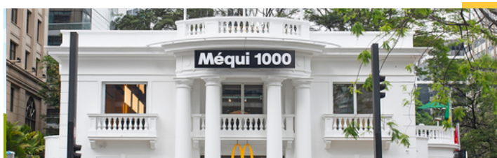
Restaurante flagship "Méqui 1000" - San Pablo

Clique aqui para acessar nosso Relatório de Compromisso Social e Desenvolvimento Sustentável.