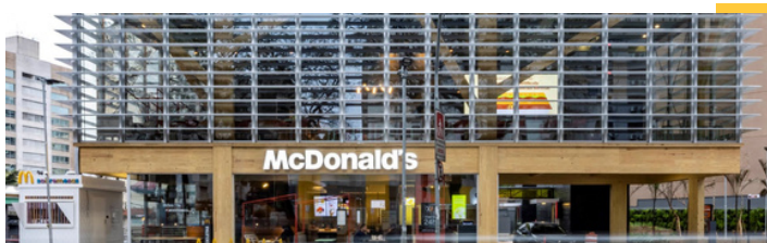
Restaurante insignia - São Paulo Brasil