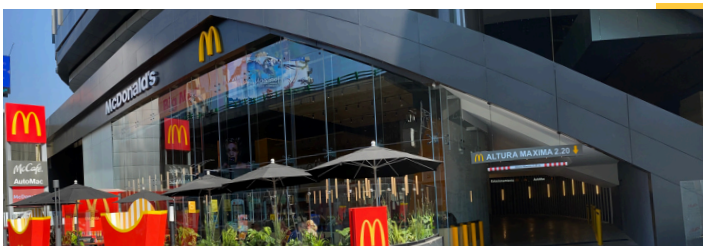
Restaurante insignia - Polanco, Ciudad de México.

Click aquí para acceder a nuestro Reporte de Compromiso Social y Desarrollo Sustentable.